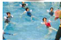
アクアサーキット