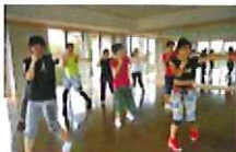
ビートファイター