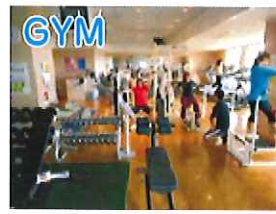
GYM ウェイトマシン フリーウェイト

25M プール・アクアビクスプール・リラクゼーションプール と多彩なアイテムが充実! 泳ぐだけがプールではありません。