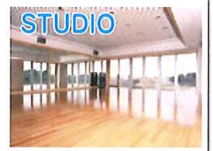
STUDIO 緑に囲まれたスタジオ