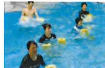
パワーサーキット