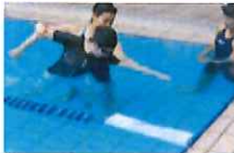
スイミングレッスン