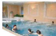
まったりリラックス