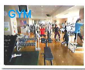
GYM ウェイトマシン フリーウェイト