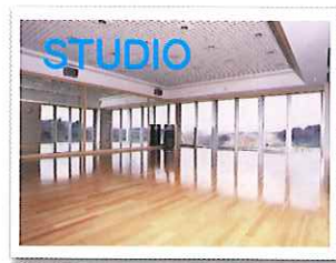
STUDIO 緑に囲まれたスタジオ