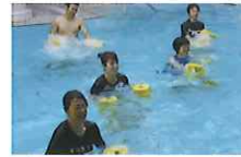
パワーサーキット