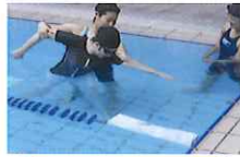
スイミングレッスン