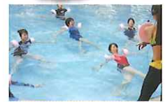
アクアサーキット