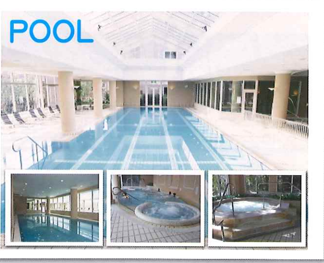
25M プール・アクアビクスプール・リラクゼーションプール と多彩なアイテムが充実!泳ぐだけがプールではありません。