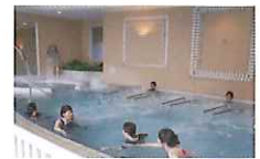
まったりリラックス