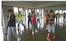
ビートファイター